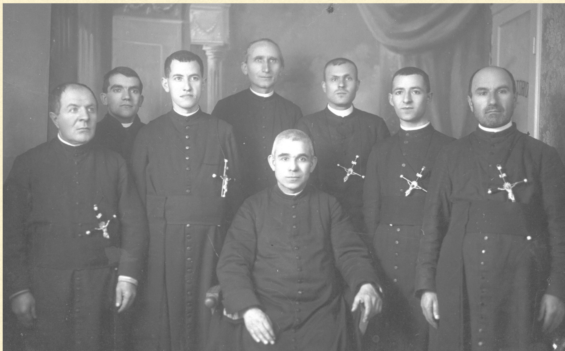
Don Orione junto a los religiosos misioneros partieron para Brasil el 20.12.1924)