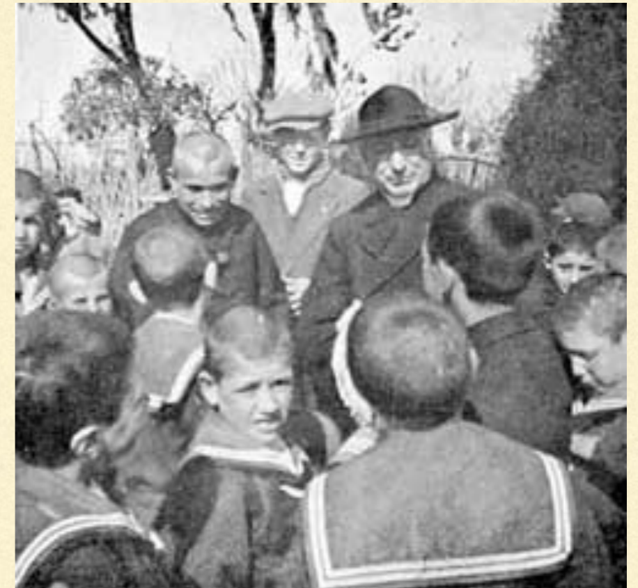
Don Orione con el obispo de Avezzano, monseñor Bagnoli, y algunos huérfanos supervivientes del terremoto (Roma, 1915)

1908: Messina—Reggio Calabria En Messina, Don Orione permaneció 3 años como Vicario General de la arquidiócesis, por decisión del Papa Pío X