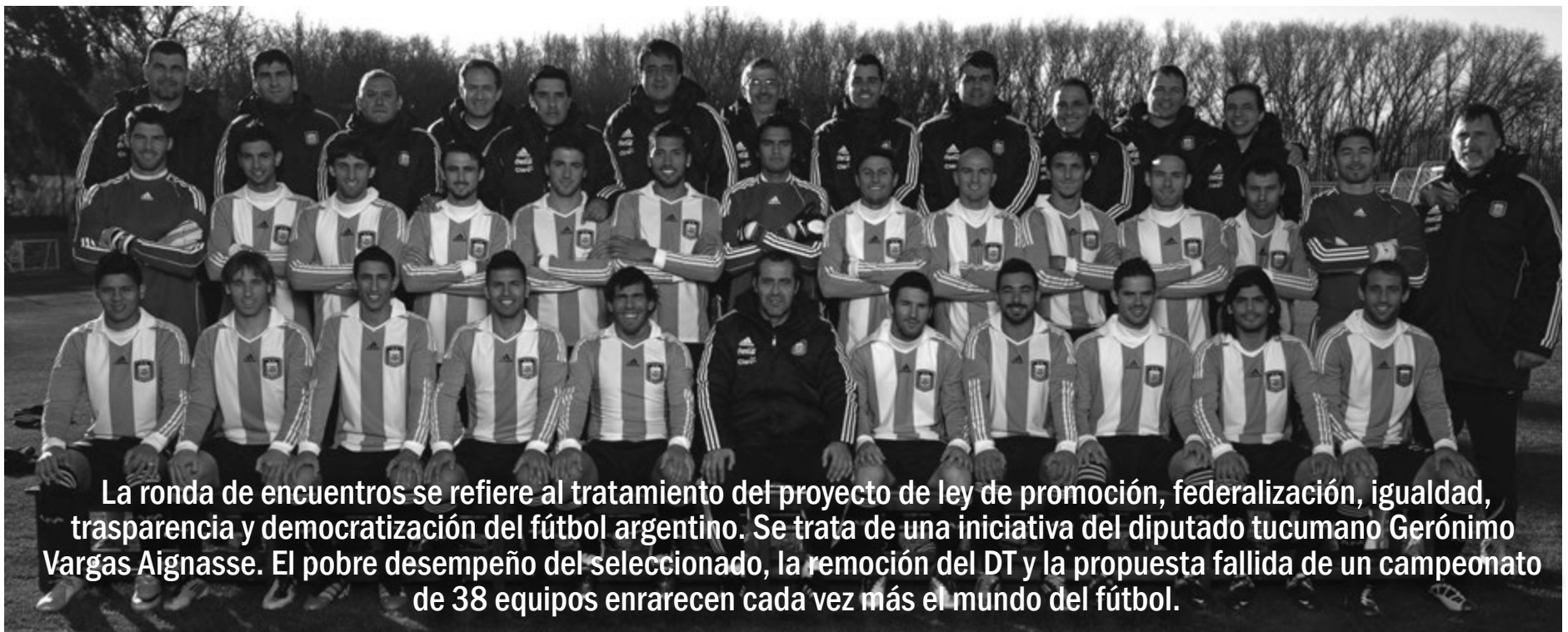
La ronda de encuentros se refiere al tratamiento del proyecto de ley de promoción, federalización, igualdad, transparencia y democratización del fútbol argentino. Se trata de una iniciativa del diputado tucumano Gerónimo Vargas Aignasse. El pobre desempeño del seleccionado, la remoción del DT y la propuesta fallida de un campeonato de 38 equipos enrarecen cada vez más el mundo del fútbol.