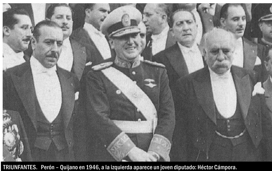
TRIUNFANTES. Perón - Quijano en 1946, a la izquierda aparece un joven diputado: Héctor Cámpora.

se ven armoniosas va a beneficiar a Binner”.