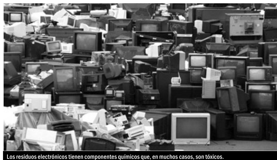
Los residuos electrónicos tienen componentes químicos que, en muchos casos, son tóxicos.