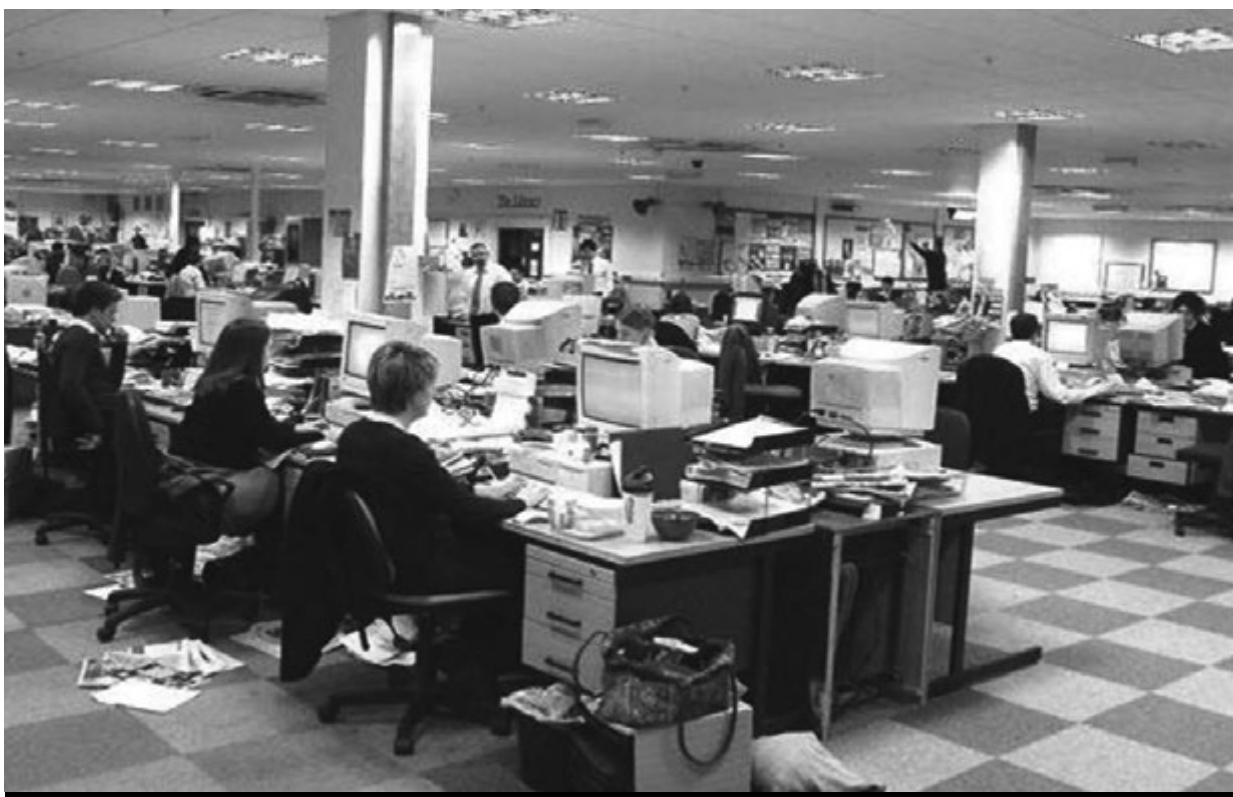
En los medios gráficos, los sueldos más bajos corresponden a los colaboradores que cobran por nota publicada.

de generar proyectos auto-generados que una década atrás. Los medios digitales instalaron en este sentido una lógica completamente distinta, en la que se puede hacer un muy buen producto con costos ínfimos.