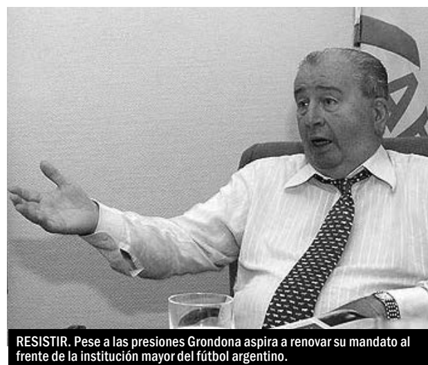
RESISTIR. Pese a las presiones Grondona aspira a renovar su mandato al frente de la institución mayor del fútbol argentino.