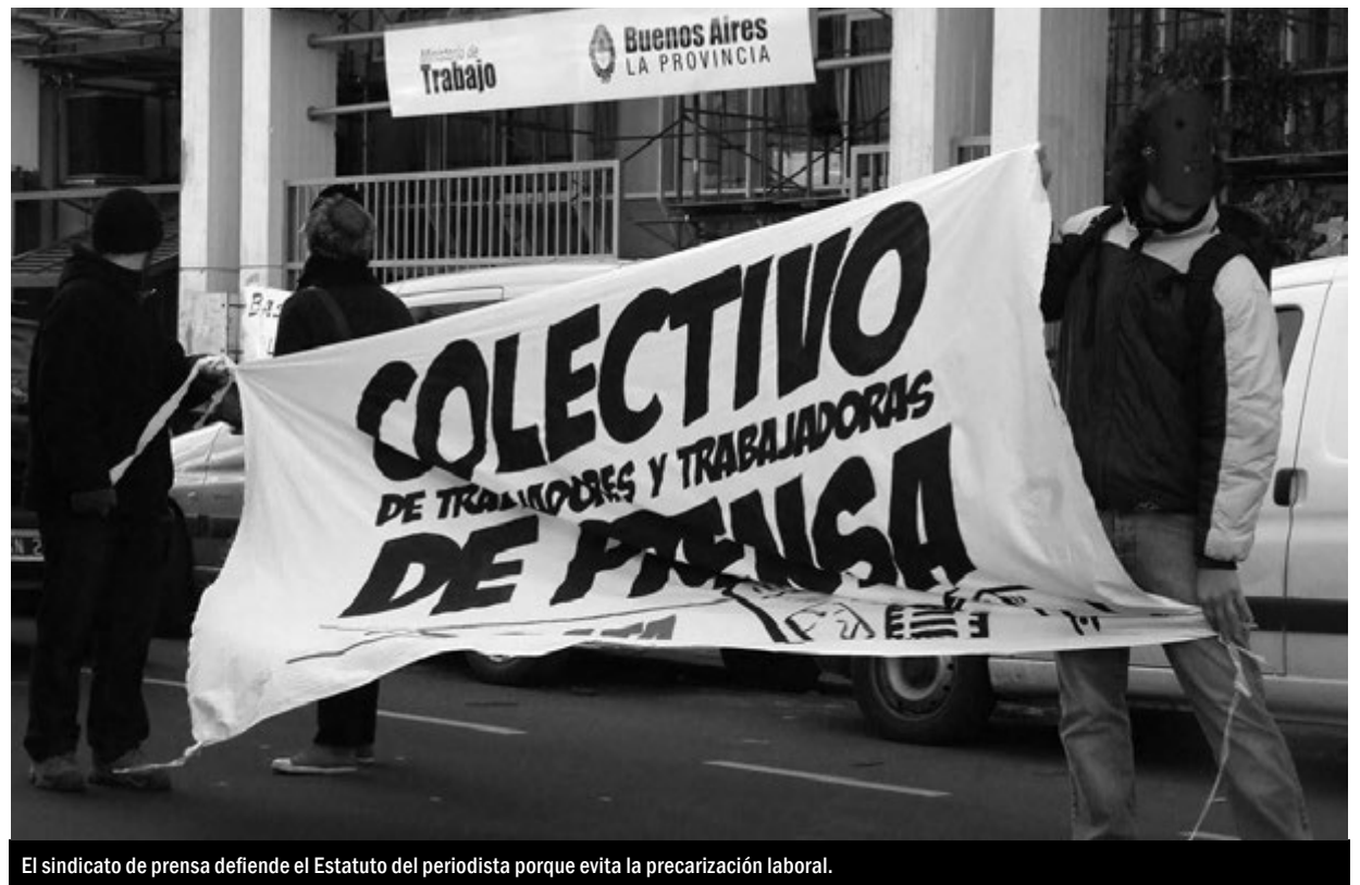
El sindicato de prensa defiende el Estatuto del periodista porque evita la precarización laboral.