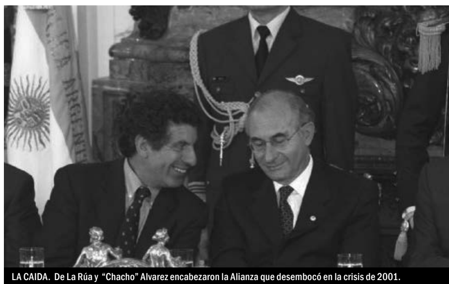
LA CAIDA. De La Rúa y “Chacho” Álvarez encabezaron la Alianza que desembocó en la crisis de 2001.