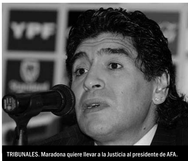
TRIBUNALES. Maradona quiere llevar a la Justicia al presidente de AFA.