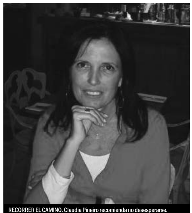
RECORRER EL CAMINO. Claudia Piñeiro recomienda no desesperarse.

Para ser más claros, se puede ilustrar esto con un ejemplo de una personalidad pública: Claudia Piñeiro, escritora de Las viudas de los jueves y Tuya, entre otros éxitos, es Contadora Pública. Su interés principal fue estudiar Sociología, pero dado los años turbulentos en los que vivía la Argentina de aquel entonces, se encaminó hacia su futura carrera