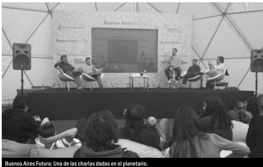
Buenos Aires Futura: Una de las charlas dadas en el planetario.