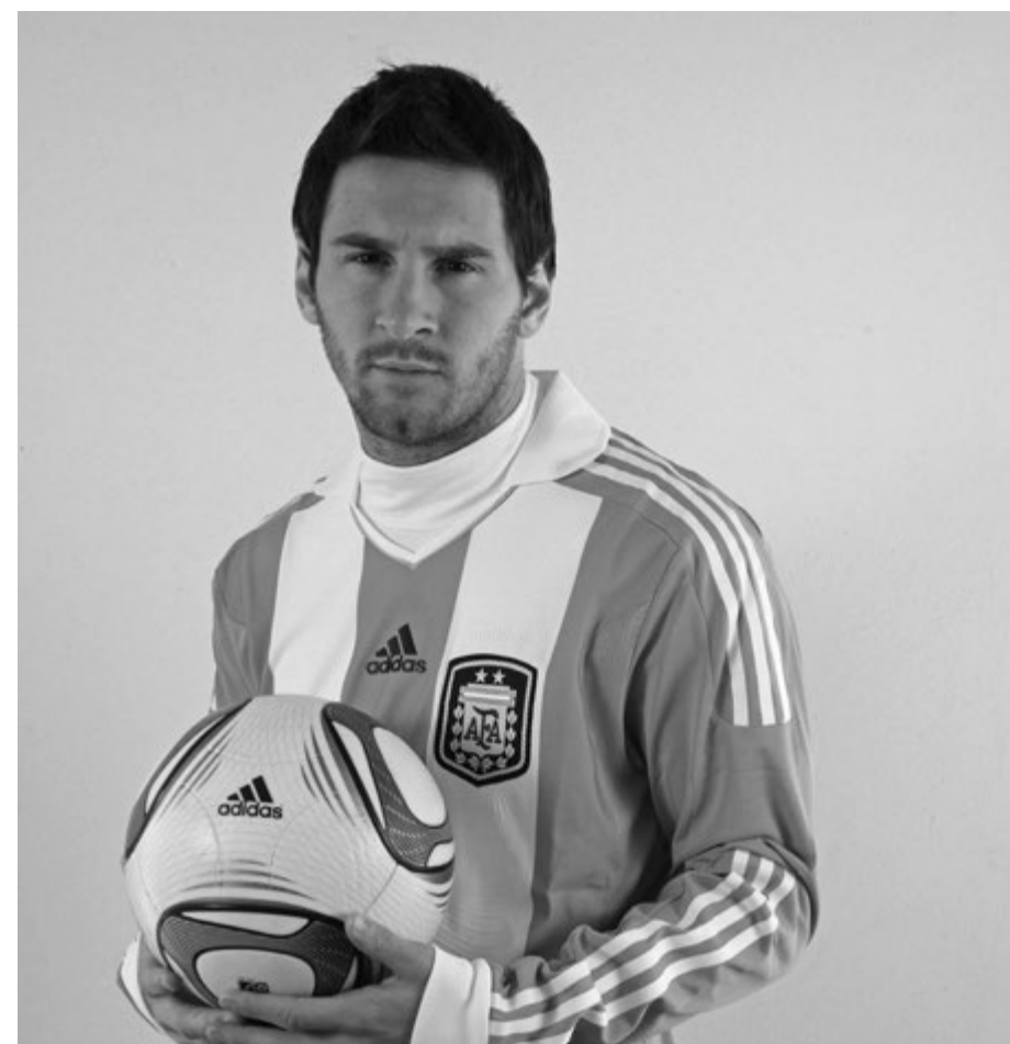
EL MÁS GRANDE. Messi tuvo una actuación sobresaliente frente a Uruguay pero no alcanzó para clasificarse.