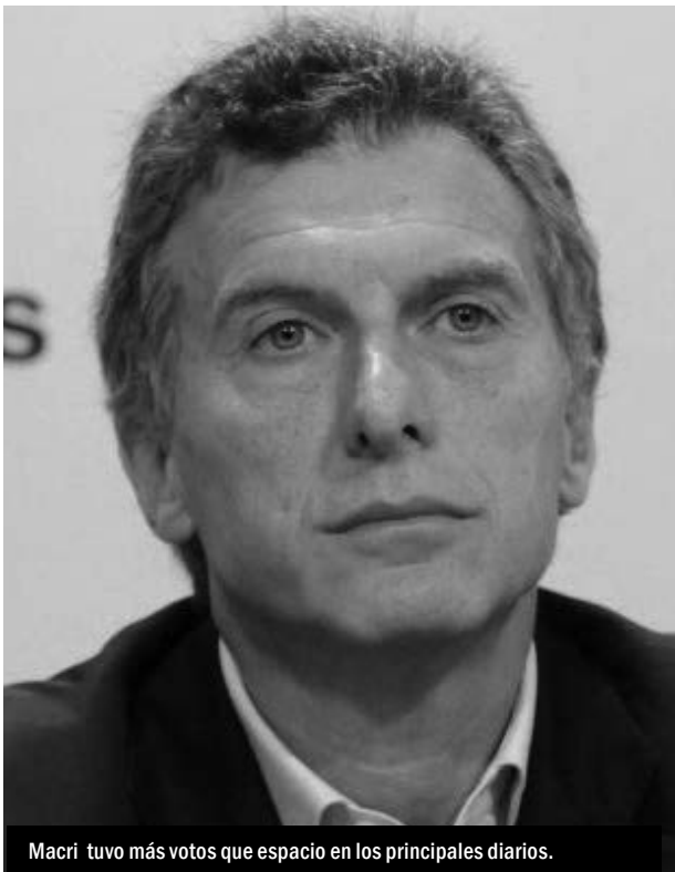
Macri tuvo más votos que espacio en los principales diarios.

El Instituto de Comunicación Social volvió a realizar este año su Observatorio Electoral, un estudio para ver cómo los diarios cubrieron las campañas porteñas.