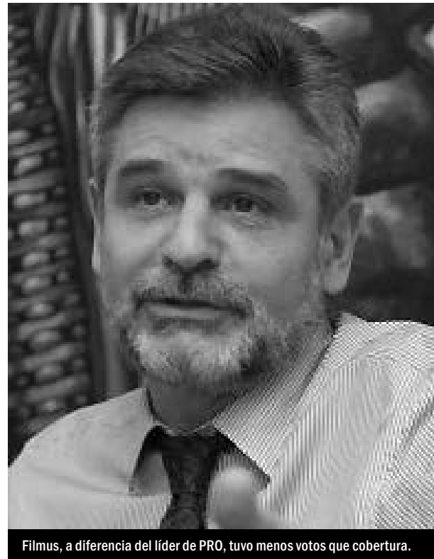
Filmus, a diferencia del líder de PRO, tuvo menos votos que cobertura.

agenda de la campaña, el estudio relevó que la categoría "análisis de campañas, partidos políticos y candidatos" fue, con el 83,5% de las menciones en tapa, el principal eje de la campaña electoral. Es decir que no hubo tema más importante que la campaña misma.